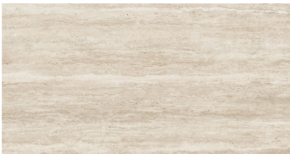
SABLE (coupe veinée) 60 x 120 cm (24" x 48") Fini mat UE.AS.SND.2448.MT.VC

Tous les items présentés dans ce document font partie du programme d'inventaire Olympia . Pour les commandes spéciales, veuillez contacter votre représentant de Tuiles Olympia.