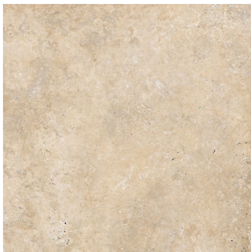
BEIGE (coupe croisée) 60 x 60 cm (24" x 24") Fini mat UE.AS.BGE.2424.MT.CC

Tous les items présentés dans ce document font partie du programme d'inventaire Olympia. Pour les commandes spéciales, veuillez contacter votre représentant de Tuiles Olympia.