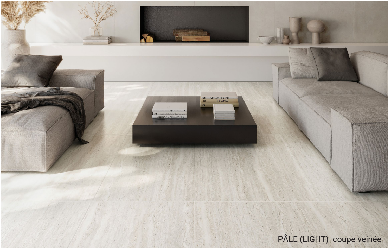
PÂLE (LIGHT) coupe veinée