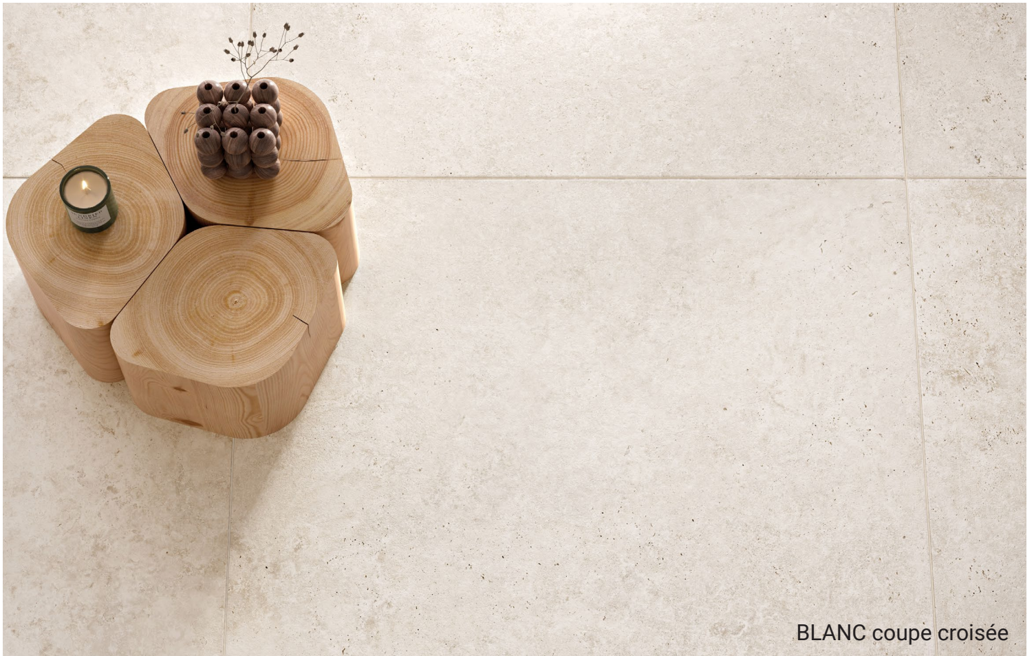
BLANC coupe croisée