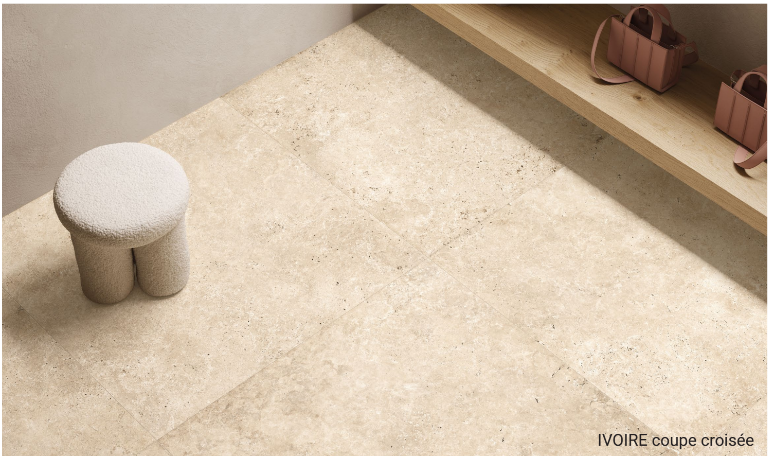
IVOIRE coupe croisée