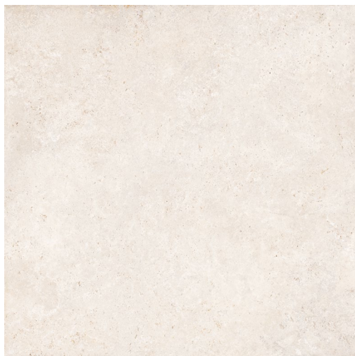
BLANC (coupe croisée) 60 x 60 cm (24" x 24") Fini mat UE.AS.WHT.2424.MT.CC