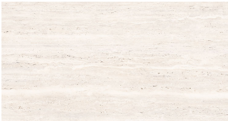
BLANC (coupe veinée) 60 x 120 cm (24" x 48") Fini mat UE.AS.WHT.2448.MT.VC