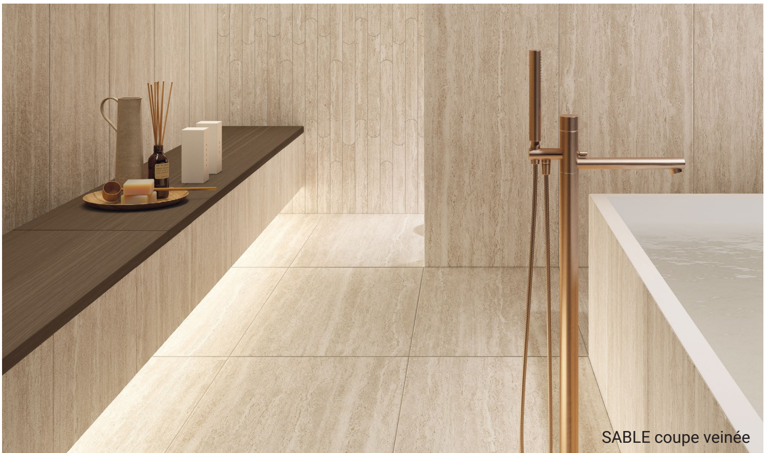
SABLE coupe veinée