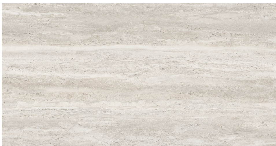
PÂLE (coupe veinée) 60 x 120 cm (24" x 48") Fini mat UE.AS.LHT.2448.MT.VC