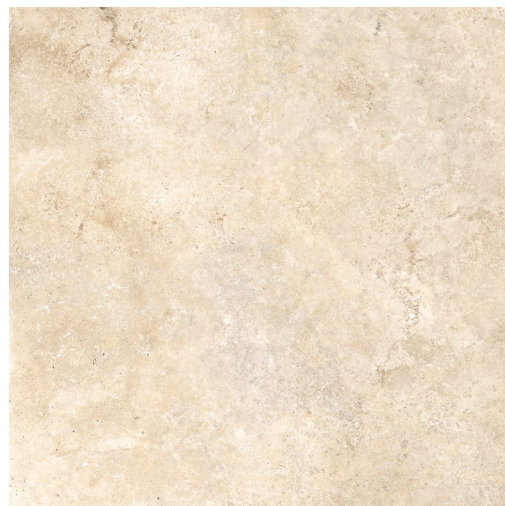
IVOIRE (coupe croisée) 60 x 60 cm (24" x 24") Fini mat UE.AS.IVO.2424.MT.CC